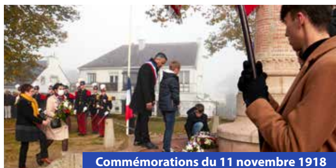
Commémorations du 11 novembre 1918