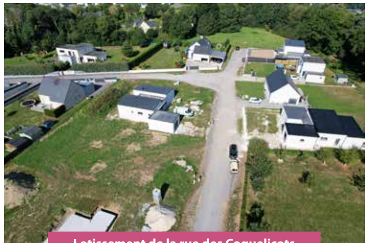
Lotissement de la rue des Coquelicots