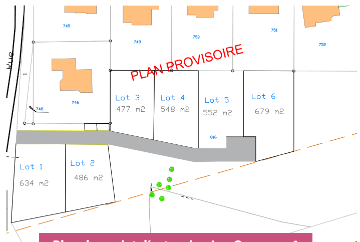
Plan du projet d'extension Les Ormeaux 4