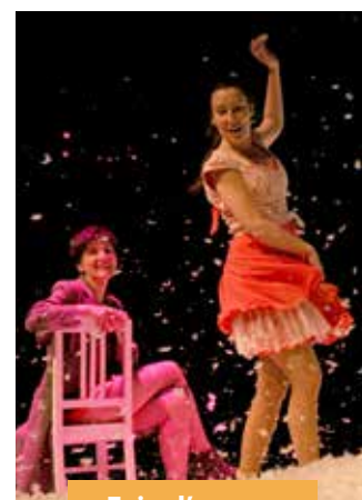
« Faire l'amour »

Retrouvez tous les rendez-vous de la saison sur www.adec56.org .