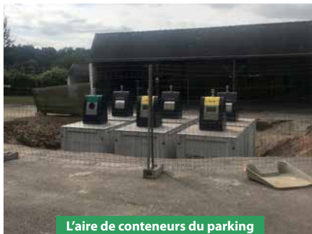
L'aire de conteneurs du parking de Kré'active56 (ex-Cap Action)

Une installation équivalente à l'entrée de l'aire de camping-car de la rue Glatinier est opérationnelle depuis fin novembre, avec 7 conteneurs cette fois semi-enterrés.