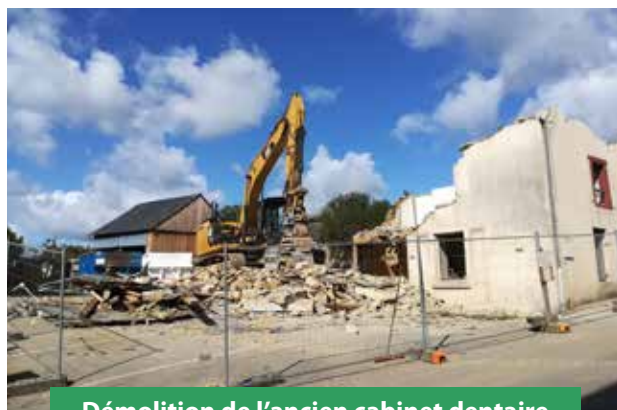
Démolition de l'ancien cabinet dentaire

Avec le concours de la Région Bretagne, le Département du Morbihan et Morbihan énergies.