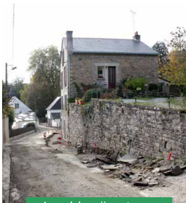
La rue de la carrière en travaux

Avec le concours de l'État - DSIL Relance, la Région Bretagne, le Département du Morbihan et Morbihan énergies.