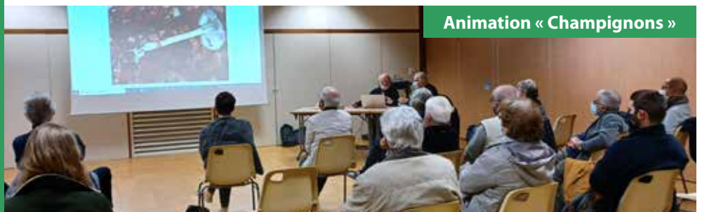
Animation « Champignons »