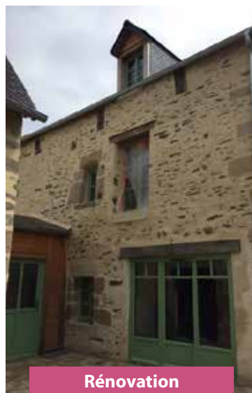
Rénovation Quartier Sainte-Croix