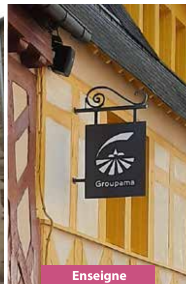
Enseigne Rue des Vierges