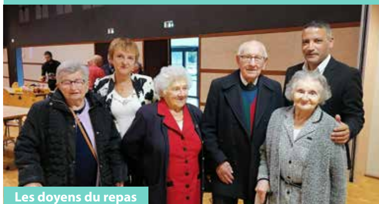
Les doyens du repas

Bonne humeur, partage et convivialité ont été les maîtres mots de la journée animée par le groupe LHYR.