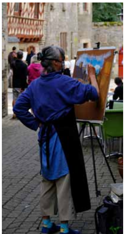
Peinture avec Couleurs de Bretagne