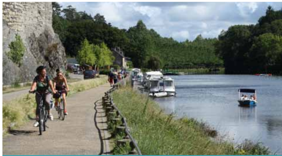
À pied, à vélo ou en bateau, il y a du monde au bord du Canal