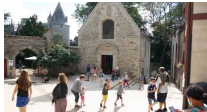
Place de la Congrégation

"Bonjour, de passage dans votre ville avec nos enfants, nous tenions à vous remercier de l'accueil et du service que vous proposez au camping-car !