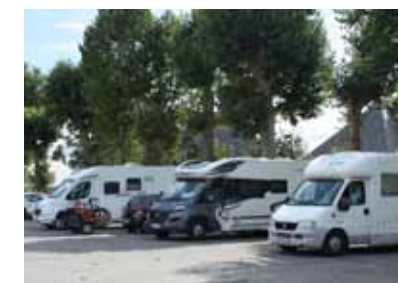
Beaucoup de camping-cars