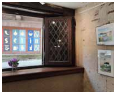
Exposition à la maison du Papegault