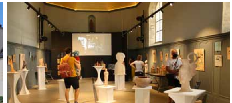
Exposition à la Chapelle de la Congrégation