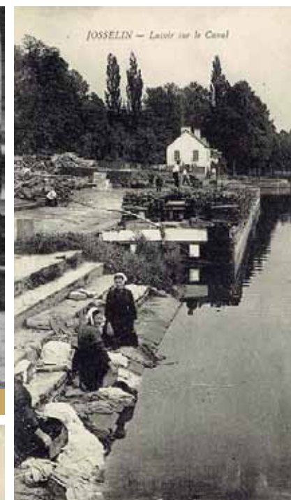
Lavoir sur le canal