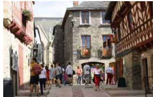
Beaucoup de visiteurs cet été