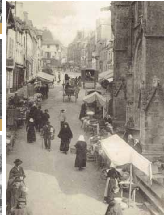
Rue Olivier de Clisson