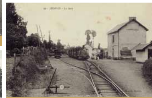
L'ancienne gare de Josselin