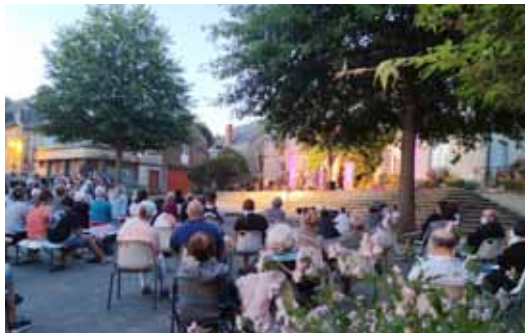
Nombreux spectateurs pour les Festiv'été