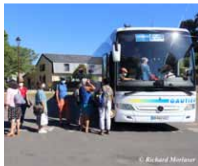
La navette Vannes-Josselin