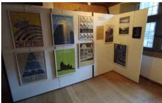
Exposition à la Maison des Porches