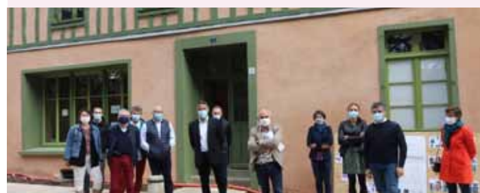
Maison Delamarque, 4 rue des trente Inauguration le 25/09 en présence du Maire