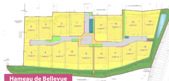
Hameau de Bellevue

Dans l'extension du lotissement au hameau de Bellevue, 12 lots ont été vendus sur les 17 disponibles. Sur le lotissement des coquelicots, les 7 lots sont vendus. Il est envisagé de réaliser une extension du lotissement des Ormeaux pour y créer 5 terrains constructibles.