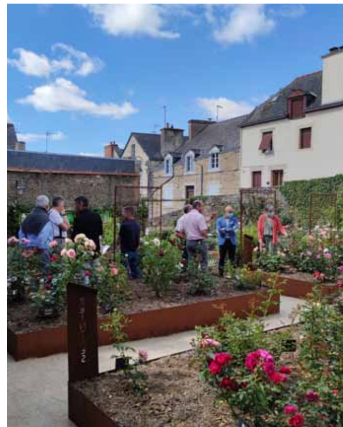
Candidature pour la 4 ème fleur Villes et villages fleuris

Nous avons passé une superbe journée, avec la visite du beau château de Josselin, la découverte des bonnes crêperies et nous avons apprécié manger des glaces. Nous reviendrons avec grand plaisir. Bonne journée Rémi"