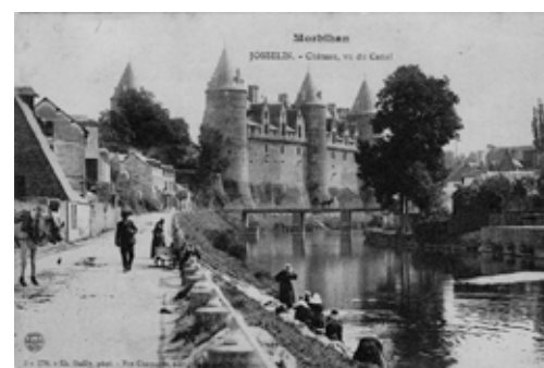
Château, vu du canal