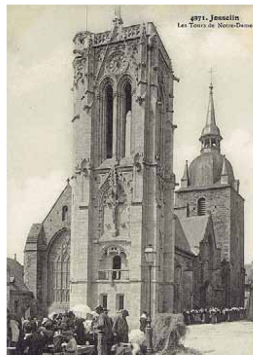
Les tours de Notre Dame du Roncier