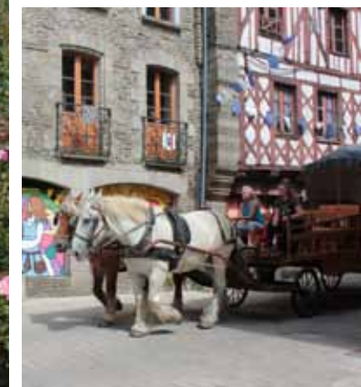
Balade en calèche