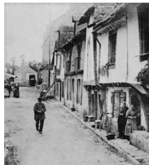
Rue des Vierges