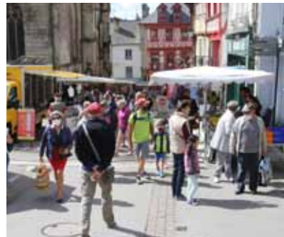
Le marché du samedi