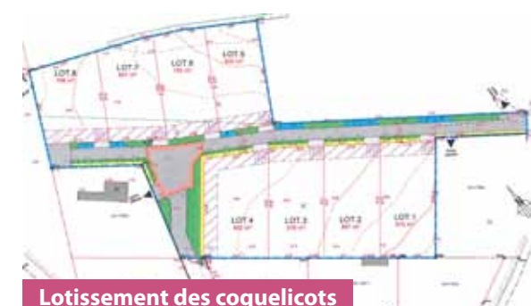
Lotissement des coquelicots