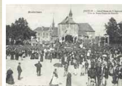
Le pardon de Notre Dame