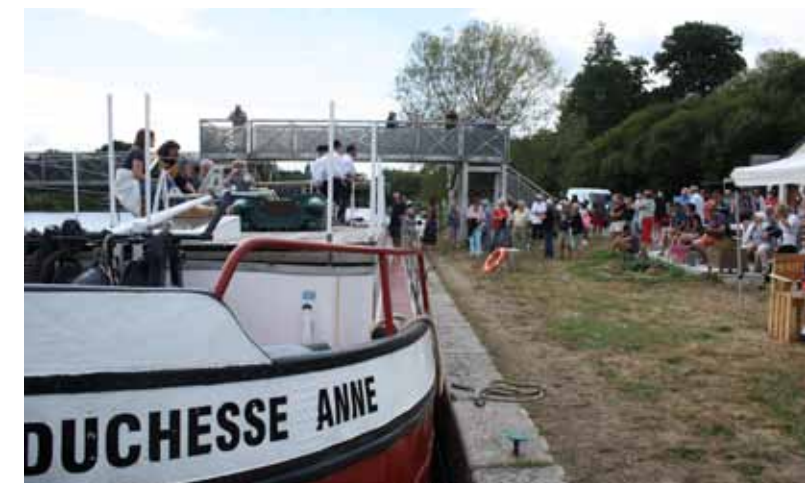
La péniche Duchesse Anne à la maison éclusière 38 du Rouvray