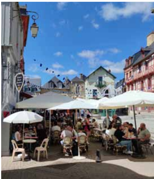
Des terrasses qui reprennent vie