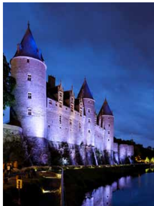
Les Illuminations nocturnes