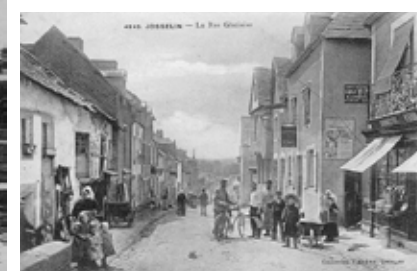
La Rue Glatinier